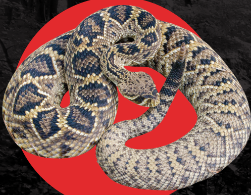
Cascabel (crótalo) Oriental Dorso de Diamante