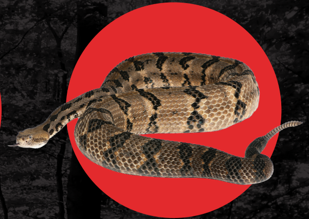
Casabel de los Cañaverales