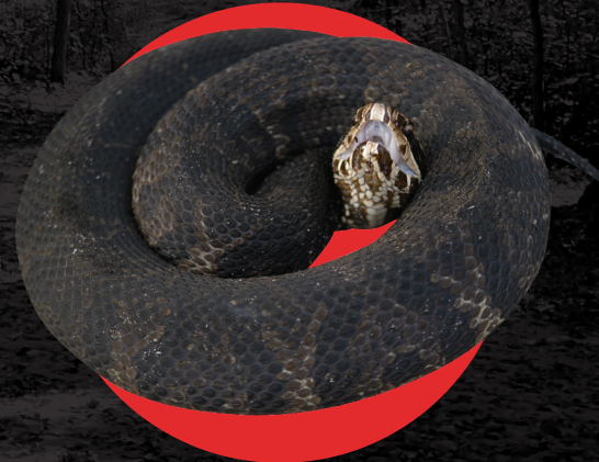
Mocasín de Agua